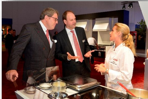
Impressionen von der IFA 2016