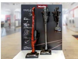
Foto 3: Drei kabellose Staubsauger in einem: Das PoS-Display zeigt das einzigartige 3in1 Design des Miele Triflex HX1. (Foto: Miele)

Foto 2: Definiert die Kombination von Flexibilität, Kraft und Geschwindigkeit neu: der innovative Miele Triflex HX1. (Foto: Miele)