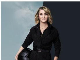
Foto 1: „Echte Freiheit bedeutet unendliche Möglichkeiten“, sagt die dreifache Kunstflug-Weltmeisterin Aude Lemordant im neuen Spot zum Miele Triflex HX1.