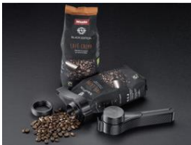
Foto 4: Mit dem 3D4U Kaffee-Clip bleiben Kaffeebohnen in bereits geöffneten Beuteln länger frisch.