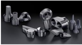
Foto 1: Nützliches Zubehör zum Selberdrucken: Zum Start von 3D4U bietet Miele zehn Objekte an.