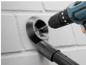
Foto 2: Der strömungsoptimierte Bohrlochabsauger saugt sich an der Wand fest und muss nicht gehalten werden.