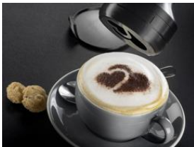
Foto 5: Individuell und kreativ lassen sich die Motive für den 3D4U Dekor-Dosierer selbst gestalten.

Download Text und Fotos: www.miele-presse.de