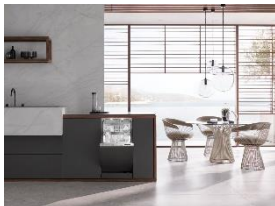
Foto 2: Die neuen 45-cm-Geschirrspüler G 5000 SL bieten mit ihrer attraktiven Ausstattung maximalen Komfort auf kleinem Raum, wie zum Beispiel mit der BrilliantLight-Beleuchtung im vollintegrierten Modell G 5890 SCVi. (Foto: Miele)

Foto 1: Mit der bewährten Funktion QuickPowerWash und den darauf abgestimmten 'UltraTabs All in 1' von Miele sind Geschirr und Besteck in 58 Minuten wieder sauber. (Foto: Miele)