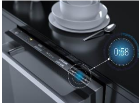
Foto 1: Mit der bewährten Funktion QuickPowerWash und den darauf abgestimmten 'UltraTabs All in 1' von Miele sind Geschirr und Besteck in 58 Minuten wieder sauber.