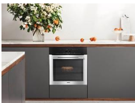
Foto 2: Kochvergnügen pur bieten die Küchengeräte aus dem Upgreat-Mietmodell von Miele. Als Herd sind grundsätzlich nur hochwertige selbstreinigende Pyrolysemodelle im Angebot.