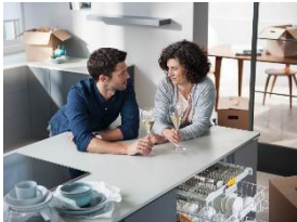
Foto 1: Sorgenfrei zu einer neuen Küchenausstattung mit Miele-Geräten: Mit Upgreat werden die Küchengeräte für einen Zeitraum gemietet und anschließend zurückgegeben.