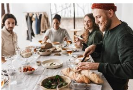
Foto 3: Mit einer Top-Geräteausstattung kann die erste Küchenparty in der neuen Wohnung steigen. Wer sich nicht auf lange Zeit festlegen möchte, mietet dazu einfach die Küchengeräte von Miele für einen Zeitraum zwischen einem und drei Jahren.