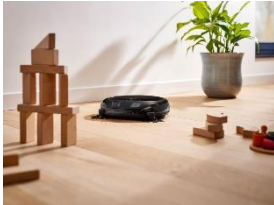
Foto 2: Aufgrund seiner intelligenten Navigation erkennt und umkurvt der Miele-Saugroboter Möbel und Gegenstände.