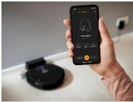
Foto 3: Die neue Miele Scout App ermöglicht eine problemlose Bedienung auch von unterwegs – für ein sauberes Zuhause zum Feierabend.

Download Text und Fotos: www.miele-presse.de