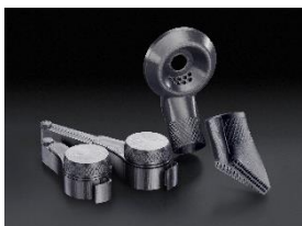
Foto 1: Nützliches Zubehör aus dem 3D-Drucker: Der Miele Online-Shop bietet nun einen Wertteilabscheider, Bohrlochabsauger und einen Kaffee-Clip in zwei Größen, für kleine Beutel mit 250 Gramm und große mit 1000 Gramm Inhalt, an.