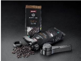
Foto 2: Mit dem Kaffee-Clip bleiben Kaffeebohnen und anderes Schüttgut in bereits geöffneten Beuteln länger frisch.