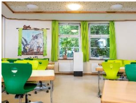
Foto 4: Auch in der Cafeteria der Ganztagsgrundschule Sternschanze sorgt ein Miele AirControl für gefilterte Luft und Virenschutz.

Download Text und Fotos: www.miele-presse.de