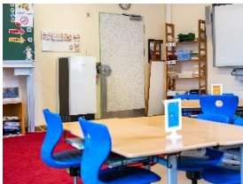
Foto 1: „Neuzugang“ in vielen Hamburger Grundschulen: ein Luftreiniger Miele AirControl.