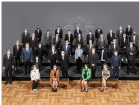
Foto 2: Miele-Jubilarinnen und -Jubilare zusammen mit der Geschäftsleitung und Mitgliedern des Betriebsrates – 50 und 40 Jahre (Gruppe 1).