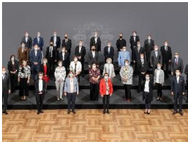
Foto 4: Miele-Jubilarinnen und -Jubilare zusammen mit der Geschäftsleitung und Mitgliedern des Betriebsrates – 40 und 25 Jahre (Gruppe 3).