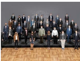
Foto 5: Miele-Jubilarinnen und -Jubilare zusammen mit der Geschäftsleitung und Mitgliedern des Betriebsrates – 25 Jahre (Gruppe 4).