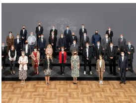
Foto 6: Miele-Jubilarinnen und -Jubilare zusammen mit der Geschäftsleitung und Mitgliedern des Betriebsrates – 25 Jahre (Gruppe 5).