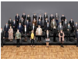
Foto 3: Miele-Jubilarinnen und -Jubilare zusammen mit der Geschäftsleitung und Mitgliedern des Betriebsrates – 40 Jahre (Gruppe 2).