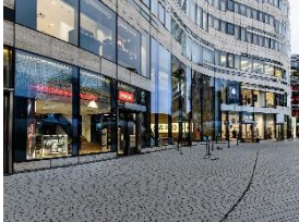
Foto 5: Ein Blick von außen: Der neue Miele Marken Store an der Königsallee 2 („Kö-Bogen“), mit Nachbarn wie Apple, Breuninger, Faber-Castell, Joop! oder Porsche Design – und nur wenige Schritte entfernt von Königsallee und Schadow Arcaden.

Einen ersten Video-Rundgang durch den Marken Store finden Sie hier.