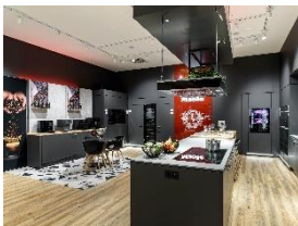
Foto 2: Der „Genussbereich“: Hier begrüßt Miele seine Kundinnen und Kunden mit einem frischen Kaffee, Espresso, Cappuccino oder einer Latte Macchiato. Es gibt Showcooking mit Expertentipps und Kostproben und, wenn gewünscht, den passenden Rahmen für das ausführliche individuelle Beratungsgespräch. (Foto: Miele)

Foto 1: Ein erster Blick in den neuen Miele Marken Store, mit den aktuellen Highlights zur Wäschepflege und der Treppe zum Store der Miele-Tochter Otto Wilde Grillers. Die Kücheneinbaugeräte mit Aktivküche fürs Showcooking folgt im hinteren Teil. (Foto: Miele)