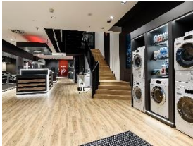
Foto 1: Ein erster Blick in den neuen Miele Marken Store, mit den aktuellen Highlights zur Wäschepflege und der Treppe zum Store der Miele-Tochter Otto Wilde Grillers. Die Kücheneinbaugeräte mit Aktivküche fürs Showcooking folgt im hinteren Teil.