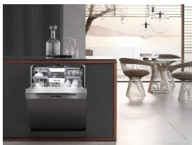
Foto 3: Der integrierte Miele-Geschirrspüler G 7110 SCi AutoDos ist Testsieger bei der Stiftung Warentest. Das Gerät erhält Bestnoten für Handhabung, beim Geräusch und bei der Sicherheit. Zudem hat es die „niedrigsten Betriebskosten im guten Eco-Programm“. (Foto: Miele)

Foto 2: Der vollintegrierte Miele-Geschirrspüler G 7160 SCVi AutoDos ist Testsieger bei der Stiftung Warentest. Das Gerät erhält Bestnoten für Handhabung, beim Geräusch und bei der Sicherheit. Zudem hat es die „niedrigsten Betriebskosten im guten Eco-Programm“. (Foto: Miele)