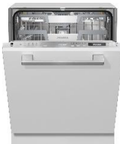
Foto 2: Der vollintegrierte Miele-Geschirrspüler G 7160 SCVi AutoDos ist Testsieger bei der Stiftung Warentest. Das Gerät erhält Bestnoten für Handhabung, beim Geräusch und bei der Sicherheit. Zudem hat es die „niedrigsten Betriebskosten im guten Eco-Programm“. (Foto: Miele)

Foto 1: Der vollintegrierte Miele-Geschirrspüler G 7160 SCVi AutoDos ist Testsieger bei der Stiftung Warentest. Das Gerät erhält Bestnoten für Handhabung, beim Geräusch und bei der Sicherheit. Zudem hat es die „niedrigsten Betriebskosten im guten Eco-Programm“. (Foto: Miele)