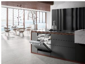
Foto 1: Der vollintegrierte Miele-Geschirrspüler G 7160 SCVi AutoDos ist Testsieger bei der Stiftung Warentest. Das Gerät erhält Bestnoten für Handhabung, beim Geräusch und bei der Sicherheit. Zudem hat es die „niedrigsten Betriebskosten im guten Eco-Programm“.