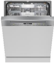
Foto 4: Der integrierte Miele-Geschirrspüler G 7110 SCi AutoDos ist Testsieger bei der Stiftung Warentest. Das Gerät erhält Bestnoten für Handhabung, beim Geräusch und bei der Sicherheit. Zudem hat es die „niedrigsten Betriebskosten im guten Eco-Programm“.

Download Text und Fotos: www.miele-presse.de