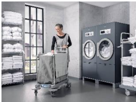
Foto 2: Vernetzbare Geräte für die hauseigene Wäscherei: Neue Miele-Trockner der Generation SlimLine.

Download Text und Fotos: www.miele-presse.de