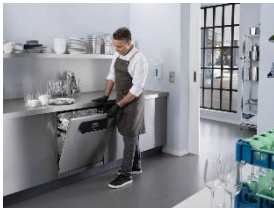
Foto 1: Hygienisch sauberes Geschirr, sogar im Programm „Super Kurz“ mit einer Laufzeit von nur fünf Minuten: Frischwasserspüler der Serie MasterLine von Miele sind in Restaurantküchen erste Wahl.