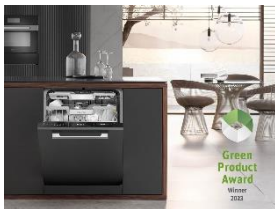
Foto 1: Der Miele G 7465 SCVi XXL AutoDos hat den Green Product Award 2023 in der Kategorie Küche gewonnen.