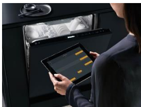
Foto 3: Die transparente Angabe der Verbrauchswerte in der Miele App findet lobende Worte in der Jury-Entscheidung.

Download Text und Fotos: www.miele-presse.de