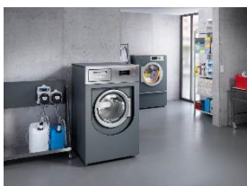
Foto 2: Modernste Miele-Wäschereimaschinen inklusive Dosiertechnik: Für Miet- und Leasingverträge gibt es optional einen Umzugsservice, der die vorübergehende Einlagerung abdeckt. Am neuen Einsatzort baut der Miele-Service alles wieder auf und sorgt für einen reibungslosen Start. (Foto: Miele)

Foto 1: Vernetzungsfähige Miele-Wäschereimaschinen ermöglichen eine Kontrolle der Betriebsdaten über mobile Endgeräte – und können nicht nur gekauft, sondern auch gemietet oder geleast werden. (Foto: Miele)