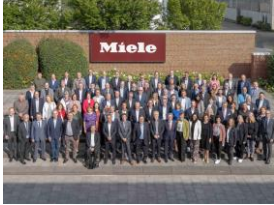
Foto 2: Die Miele-Geschäftsleitung mit den Jubilarinnen und Jubilaren aus Gütersloh.