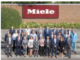
Foto 5: Die Miele-Geschäftsleitung mit den Jubilarinnen und Jubilaren aus den internationalen Werken und Vertriebsgesellschaften.

Download Text und Fotos: www.miele-presse.de