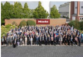
Foto 1: Die Miele-Geschäftsleitung mit allen Jubilarinnen und Jubilaren aus insgesamt 15 Ländern.