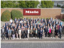
Foto 4: Die Miele-Geschäftsleitung mit den Jubilarinnen und Jubilaren aus Bielefeld, Euskirchen, Lehrte und Oelde.