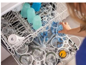
Foto 3: Oben Mischgeschirr, unten Flaschen, Karaffen oder Vasen: Von der Miele-Lösung profitiert der Arbeitsalltag in der belgischen Seniorenresidenz De Medemens St. Bavo.