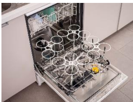
Foto 1: Flaschenkorb APFD 210 von Miele für 16 wiederverwendbare Flaschen aus Glas oder Kunststoff: Durch Injektordüsen gelangt das Wasser bis zu den Böden von hohen Gefäßen, sodass für eine hygienische Reinigung von außen und innen gesorgt ist.