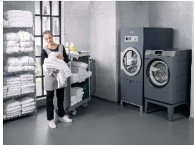
Foto 2: Für die älteste gewerbliche Waschmaschine in Deutschland, Österreich und der Schweiz stellt Miele je eine Profi-Waschmaschine für elf Kilogramm Füllgewicht (rechts) zur Verfügung. Hier ist sie platzsparend mit einem Trockner aus der Baureihe SlimLine kombiniert.

Download Text und Fotos: www.miele-presse.de