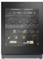
Foto 7: Klein, aber fein mit Designpreis: Die neuen Weinschränke von Miele kommen im Frühjahr/Sommer auf den Markt.