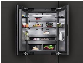
Foto 6: Für größere Maßstäbe: Die neuen Kühl- und Gefriergeräte der Serie MasterCool von Miele kommen im Herbst auf den Markt.