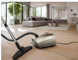
Foto 1: Für alle drei Guard-Serien S1, M1 und L1 von Miele gab es einen Designpreis, im Bild der Guard L1 Comfort in Titanium PearlFinish.