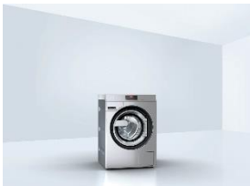
Foto 12: Unkompliziert bedienbar und nun mit dem iF Design Award ausgezeichnet sind die Profi-Waschmaschinen der Serie PWM 509, PWM 909 und PWM 511 von Miele.