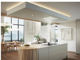
Foto 8: Vielfältige Gestaltungsoptionen gehen mit unkomplizierter Installation einher. Dafür erhielt das Deckengebläse Stella von Miele den iF Design Award.