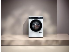
Foto 3: Das Spitzenmodell der neuen Waschmaschinen-Generation, die W2 Nova Edition, wurde für seine Ästhetik, aber auch für Technik und Komfort mit dem iF Design Award ausgezeichnet.