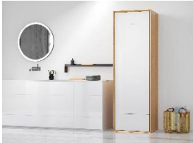
Foto 5: Auffrischen, glätten oder trocknen – der Wäschepflegeschränk Aerium von Miele überzeugte beim iF Award mit Konzept und Design.