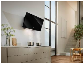
Foto 10: Kopffrei-Dunstabzugshaube von Miele: Die Haube Escala überzeugt mit minimalistischem Design und erhielt dafür einen iF Design Award.