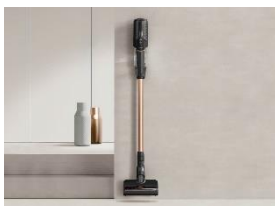
Foto 2: Der Duoflex Akku-Staubsauger von Miele überzeugte beim iF Design Award nicht nur optisch, sondern auch durch schnelle Handhabung und starke Leistung. (Foto: Miele)

Foto 1: Für alle drei Guard-Serien S1, M1 und L1 von Miele gab es einen Designpreis, im Bild der Guard L1 Comfort in Titanium PearlFinish. (Foto: Miele)