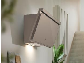
Foto 9: Das Top-Modell Sienna der Kopffrei-Dunstabzugshauben von Miele erhielt einen iF Design Award für seinen eleganten Auftritt, aber auch für seine hohe Leistung bei sehr geringem Absauggeräusch.