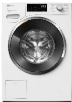
Foto 2: Der „Energy Hero“ ist das energieeffizienteste Gerät im Miele-Produktportfolio – 40 Prozent sparsamer als der Grenzwert der Energieeffizienzklasse A und ausgestattet mit komfortablen Features. (Foto: Miele)

Foto 1: Der „Energy Hero“ ist das energieeffizienteste Gerät im Miele-Produktportfolio – 40 Prozent sparsamer als der Grenzwert der Energieeffizienzklasse A und ausgestattet mit komfortablen Features. (Foto: Miele)