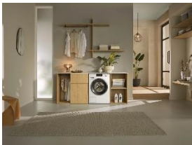
Foto 1: Der „Energy Hero“ ist das energieeffizienteste Gerät im Miele-Produktportfolio – 40 Prozent sparsamer als der Grenzwert der Energieeffizienzklasse A und ausgestattet mit komfortablen Features.