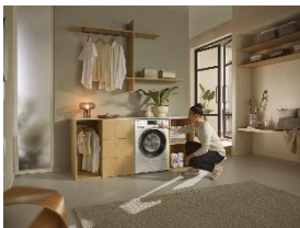
Foto 3: Ab April 2025 startet Miele mit einer umfassenden Neuausrichtung seines Wäschepflege-Sortiments und wertet sein Programm in puncto Komfort, Effizienz und Leistung weiter auf. Gleichzeitig reduziert der Gütersloher Hausgerätehersteller seine Preispunkte für beliebte Ausstattungsmerkmale und Features deutlich, die teilweise bis zu 420 Euro unter dem bisherigen Preisgefüge liegen. (Foto: Miele)

Foto 2: Der „Energy Hero“ ist das energieeffizienteste Gerät im Miele-Produktportfolio – 40 Prozent sparsamer als der Grenzwert der Energieeffizienzklasse A und ausgestattet mit komfortablen Features. (Foto: Miele)