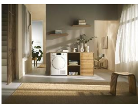
Foto 4: Auch bei den Trocknern wertet Miele sein Sortiment deutlich auf – zu unveränderten Preisen. Beispielsweise sind künftig selbst die Einstiegsgeräte in die höchsten Energieeffizienzklasse A+++ (statt bisher A++) eingestuft, womit Miele erneut seine Vorreiterrolle in puncto Nachhaltigkeit unterstreicht. (Foto: Miele)

Foto 3: Ab April 2025 startet Miele mit einer umfassenden Neuausrichtung seines Wäschepflege-Sortiments und wertet sein Programm in puncto Komfort, Effizienz und Leistung weiter auf. Gleichzeitig reduziert der Gütersloher Hausgerätehersteller seine Preispunkte für beliebte Ausstattungsmerkmale und Features deutlich, die teilweise bis zu 420 Euro unter dem bisherigen Preisgefüge liegen. (Foto: Miele)