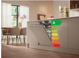
Foto 1: Maximale Effizienz für jede Küche: Miele bringt Energieeffizienzklasse A bei Geschirrspülern über alle Preisklassen hinweg.