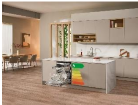
Foto 2: Nachhaltig spülen in jeder Preisklasse: Miele bringt Energieeffizienzklasse A über das gesamte Geschirrspüler-Sortiment hinweg.