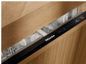
Foto 4: Top-Feature AutoOpen: Für optimale Trocknungsergebnisse – jetzt in allen Preisklassen verfügbar.