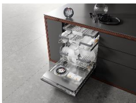
Foto 5: Mehr Komfort mit AutoDos: G 7000 bietet die automatische Dosierhilfe – für exzellente Reinigungsergebnisse bei jeder Beladung.