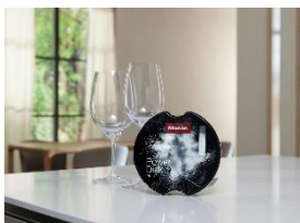
Foto 6: Automatisch perfekt dosiert: AutoDos mit integrierter PowerDisk liefert optimale Reinigungsergebnisse.