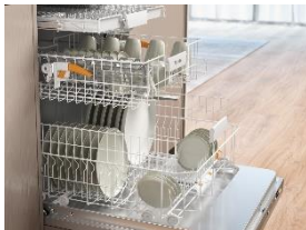
Foto 3: Energieeffizienz in jeder Preisklasse: Miele bietet Geschirrspüler der Energieeffizienzklasse A im gesamten Sortiment.