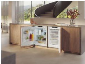
Foto 1: Die neue Generation Kühl- und Gefriergeräte für den Unterbau von Miele bietet viel Komfort und eine hochwertige Ausstattung.