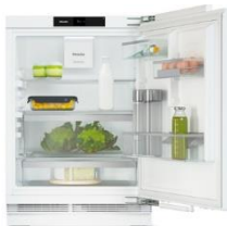
Foto 2: Der Kühlschrank KU 7135 C von Miele aus der neuen Generation der Unterbau-Geräte verfügt über viele komfortable Features, etwa ein Frischesystem und sanfte Türschließung.