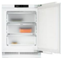
Foto 3: Der Gefrierschrank FNUS 7140 C ist für eine Nischenhöhe bis zu 92 Zentimetern ausgelegt. Er macht manuelles Abtauen dank „NoFrost“ überflüssig und ist mit der Miele App vernetzbar.