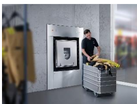
Foto 1: Waschmaschinen in Trennwandausführung bereiten Feuerwehr-Schutzanzüge auf. Die beiden voneinander getrennten Seiten verhindern, dass gelöste Schmutzpartikel auf gereinigte Textilien gelangen.