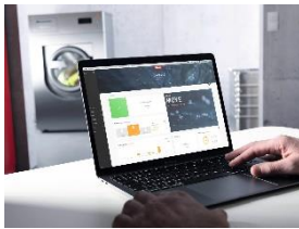
Foto 1: Eine digitale Lösung, die viele Arbeitsprozesse vereinfacht: das Portal „Miele MOVE connect“. Auf Wunsch schickt es relevante Nachrichten an mobile Endgeräte oder den PC – etwa, wenn eine Waschmaschine entladen werden kann.

Download Text und Foto: www.miele-presse.de