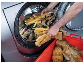
Foto 3: Handschuhe, die beim Einsatz vor Flammen schützen, werden durch eine Vorwäsche, vier weitere Waschgänge und bei 40 °C sauber. (Foto: Miele)

Foto 2: Auch für die Maschinenwäsche von Sicherheitsgurten gibt es Spezialprogramme und passende Schutzbeutel. (Foto: Miele)