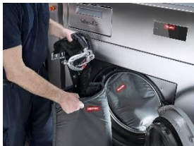
Foto 2: Auch für die Maschinenwäsche von Sicherheitsgurten gibt es Spezialprogramme und passende Schutzbeutel. (Foto: Miele)

Foto 1: In den Wäschereimaschinen „The New Benchmark Machines“ von Miele lässt sich die komplette persönliche Schutzausrüstung einer Feuerwehr aufbereiten – etwa mehrlagige Hosen und Jacken sowie Helme. (Foto: Miele)