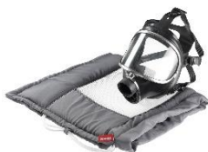
Foto 4: Für die Aufbereitung von Atemschutzmasken stehen eigene und ebenfalls gefütterte Schutzbeutel zur Verfügung. (Foto: Miele)

Foto 3: Handschuhe, die beim Einsatz vor Flammen schützen, werden durch eine Vorwäsche, vier weitere Waschgänge und bei 40 °C sauber. (Foto: Miele)