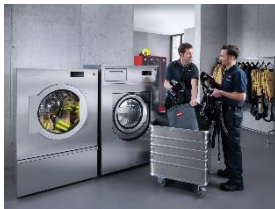
Foto 1: In den Wäschereimaschinen „The New Benchmark Machines“ von Miele lässt sich die komplette persönliche Schutzausrüstung einer Feuerwehr aufbereiten – etwa mehrlagige Hosen und Jacken sowie Helme.