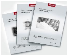
Foto 2: Gedruckte Gebrauchsanweisungen bleiben relevant. Miele reduziert lediglich deren Umfang und ergänzt sie um weitere digitale Angebote. (Foto: Miele)

Foto 1: Die Gebrauchsanweisung schnell und einfach online checken. Miele erweitert sein Portfolio um papierlose Downloads und digitale Zusatzangebote. (Foto: Miele)