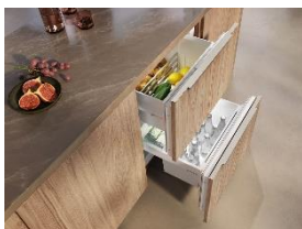
Foto 2: Ob Kartoffeln, Zucchini oder Zitronen, der Unterbau-Kühlschrank eignet sich bei 14 °C perfekt als modernes Kellerfach.