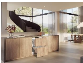
Foto 1: Die Schubladen lassen sich auf nahezu 0 °C einstellen – ideal, um Getränke platzsparend und griffbereit zu kühlen.