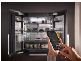
Foto 3: Innovation trifft auf Eleganz: Die neue MasterCool-Generation überzeugt mit integrierten Kameras und App-Steuerung sowie Edelstahl-Innenraum und modernem Lichtkonzept.