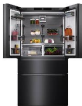
Foto 2: French Door Standgeräte: Das elegante Edelstahl setzt einen besonderen Akzent in der Küche, während „IceMaker“ und „Freeze&Cool“ höchsten Komfort und Flexibilität bieten.