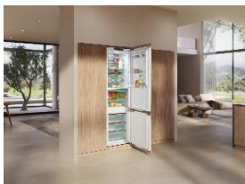
Foto 1: Deutlich mehr Platz für frische Lebensmittel: Das XXL-Einbaugerät bietet rund 45 Prozent mehr Volumen – ideal für große Wocheneinkäufe oder Vorbereitungen von Feiern.