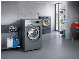
Foto 2: Modernste Miele-Wäschereimaschinen inklusive Dosiertechnik: Für Miet- und Leasingverträge gibt es optional einen Umzugsservice, der die vorübergehende Einlagerung abdeckt. Am neuen Einsatzort baut der Miele-Service alles wieder auf und sorgt für einen reibungslosen Start. (Foto: Miele)

Foto 1: Vernetzungsfähige Miele-Wäschereimaschinen ermöglichen eine Kontrolle der Betriebsdaten über mobile Endgeräte – und können nicht nur gekauft, sondern auch gemietet oder geleast werden. (Foto: Miele)