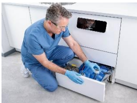
Foto 3: Für die Unterbringung von Prozesschemikalien steht unterhalb des Spülraums eine große Push-to-open-Schublade zur Verfügung, die sich durch leichten Druck öffnet. Alle Kanister können von hier aus einfach entnommen und bei Bedarf ausgetauscht werden. (Foto: Miele)

Foto 2: Viel Platz für zahnärztliches Instrumentarium, auch bei kleinem Spülraum: 22 Düsen für Hohlkörperinstrumente, für weitere Instrumente sowie für bis zu 30 Universalkanülen. (Foto: Miele)