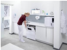
Foto 1: Kompakte Maße, große Leistung: Für Praxen mit einem geringeren Aufkommen an medizinischen oder zahnmedizinischen Instrumenten bietet Miele Professional ab November 2025 die Generation „CompactLine“ an: kompakte Reinigungs- und Desinfektionsgeräte mit einer Beladungsebene.