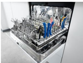
Foto 2: Viel Platz für zahnärztliches Instrumentarium, auch bei kleinem Spülraum: 22 Düsen für Hohlkörperinstrumente, für weitere Instrumente sowie für bis zu 30 Universalkanülen. (Foto: Miele)

Foto 1: Kompakte Maße, große Leistung: Für Praxen mit einem geringeren Aufkommen an medizinischen oder zahnmedizinischen Instrumenten bietet Miele Professional ab November 2025 die Generation „CompactLine“ an: kompakte Reinigungs- und Desinfektionsgeräte mit einer Beladungsebene. (Foto: Miele)