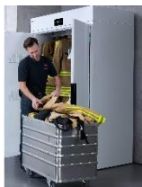
Foto 1: Mit einer Breite von 120 Zentimetern bietet der Trockenschrank „DC 120 WW“ Platz für Schutzanzüge, Handschuhe und andere Utensilien der persönlichen Schutzausrüstung.