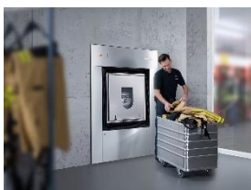
Foto 1: Waschmaschinen in Trennwandausführung bereiten Feuerwehr-Schutzanzüge auf. Die beiden voneinander getrennten Seiten verhindern, dass gelöste Schmutzpartikel auf gereinigte Textilien gelangen.