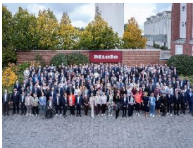
Foto 1: Die Miele-Geschäftsleitung mit allen Jubilarinnen und Jubilaren aus insgesamt 16 Ländern.