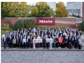
Foto 2: Die Miele-Geschäftsleitung mit den Jubilarinnen und Jubilaren aus Gütersloh.