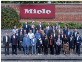
Foto 3: Die Jubilarinnen und Jubilare aus der Vertriebsgesellschaft Deutschland KG mit der Miele-Geschäftsleitung.