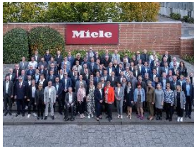
Foto 4: Die Miele-Geschäftsleitung mit den Jubilarinnen und Jubilaren aus Bielefeld, Euskirchen, Lehrte, Oelde, Warendorf und der Miele-Tochter Steelco GmbH.