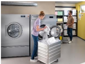
Foto 2: Die Waschmaschinen punkten mit über 90 Programmen: etwa für Bett- und Frotteewäsche, Bademäntel, Küchen- und Tischwäsche.