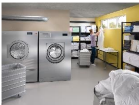
Foto 1: Viel Platz in der Trommel: Eine Waschmaschine für 35 Kilogramm Füllgewicht bietet Platz für bis zu 70 Bettlaken pro Charge.