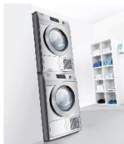
Foto 1: Hoher Durchsatz auf wenig Raum: Die neue Trockensäule von Miele überzeugt unter anderem mit niedrigen Betriebskosten.