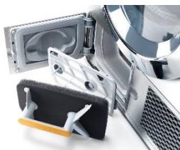
Foto 2: Gut erreichbar und schnell erledigt sind Wartungsarbeiten wie die Filterreinigung bei den „Kleinen Riesen“ von Miele.