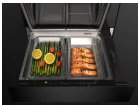
Foto 1: Die neue Dampfgarschublade von Miele – Platzsparende 3in1-Lösung zum Backen, Aufwärmen und Dampfgaren. Mit zwei getrennten Garräumen zur parallelen Zubereitung unterschiedlicher Lebensmittel.