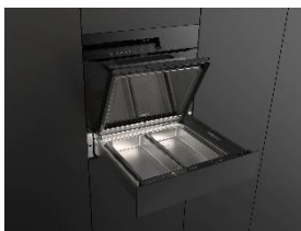
Foto 2: Clever kombiniert: Die 14 cm hohe Dampfgarschublade passt perfekt unter einen 45 cm Backofen mit Mikrowelle in die klassische 60 cm Nische. Je nach Lebensmittel kommen gelochte oder ungelochte Garschalen zum Einsatz – für punktgenaue Ergebnisse von Gemüse über Fisch und Fleisch bis Couscous oder Reis.