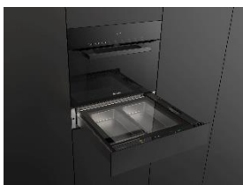
Foto 3: Die Dampfgarschublade bietet mehr als 100 Automatikprogramme und Automatisches Menügaren. Für maximale Flexibilität für unterschiedlichste Anforderungen und Menüs für bis zu vier Personen. Rund 14 Liter Garvolumen steht zur Verfügung, darin lassen sich zum Beispiel bis zu drei Kilogramm Kartoffeln gleichzeitig garen.

Download Text und Fotos: www.miele-presse.de