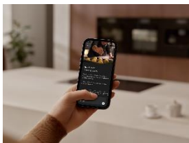
Foto 1: Das virale Rezept aus dem Netz oder der Familienklassiker: Der CulinaryCoach in der Miele App übersetzt Kochideen in passende Einstellungen und begleitet die Zubereitung Schritt für Schritt.