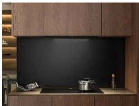
Foto 7: Die integrierte Glaspaneel-Dunstabzugshaube DAG 2950 bleibt im geschlossenen Zustand nahezu unsichtbar im Oberschrank verborgen. Beim Kochen klappt das Paneel auf, ermöglicht eine direkte Bedienung und schützt zugleich den Schrankkorpus vor aufsteigendem Dampf. (Foto: Miele)

Foto 6: Das 60-cm-Kochfeld KMDA 5649 mit integriertem Dunstabzug führt Dampf direkt an der Kochfläche ab – für eine ruhige, offene Küchengestaltung ohne visuelle Unterbrechungen. (Foto: Miele)