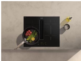
Foto 6: Das 60-cm-Kochfeld KMDA 5649 mit integriertem Dunstabzug führt Dampf direkt an der Kochfläche ab – für eine ruhige, offene Küchengestaltung ohne visuelle Unterbrechungen. (Foto: Miele)

Foto 5: Mit „Miele Compact Living: Kitchen Unit powered by Hettich“ zeigt Miele eine Designstudie für hochfunktionale und flexible Küchenlösungen – selbst auf kleinstem Raum. Durch die Verbindung von Geräten mit flexiblen Möbelsystemen reagiert das Konzept auf die steigenden Anforderungen an effizientes urbanes Wohnen, ohne Abstriche bei Leistung und Design. (Foto: Miele)