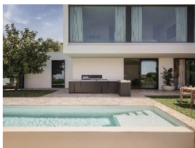
Foto 9: Mit Outdoor Cooking stellt Miele ein modulares Outdoor-Küchensystem vor, dessen Module und Zubehör sich je nach Raum, Bedarf und Lebensstil flexibel kombinieren lassen. (Foto: Miele)

Foto 8: Mit dem CulinaryCoach präsentiert Miele einen KI-gestützten Assistenten, der in Echtzeit personalisierte Kochanleitungen liefert, Nutzerinnen und Nutzer nahtlos mit ihren Geräten vernetzt und Kochen im Alltag intuitiver und flexibler macht. (Foto: Miele)