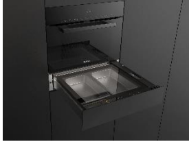
Foto 4: Die neue Dampfgeschublade von Miele bildet in Kombination mit einem 45 cm Kompaktbackofen mit Mikrowelle in einer 60-cm-Nische eine platzsparende 3-in-1-Lösung für Backen, Aufwärmen und Dampfgaren. Zwei separate Garbehälter ermöglichen die gleichzeitige Zubereitung unterschiedlicher Speisen.