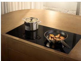
Foto 3: Smart, stilvoll, flexibel: Die neuen Kochfelder der Serie KM 8000 bieten maximale Freiheit und großzügigen Raum zum Kochen. Das intelligente System aus Induktionskochfeld der Serie KM8000 und M Sense Kochgeschirr mit bis zu drei Temperatursensoren regelt Temperatur und Leistung automatisch – nichts brennt an, nichts kocht über. (Foto: Miele)

Foto 2: Auf der Milan Design Week 2026 präsentiert Miele seine neuesten Produktinnovationen in einem immersiven Standkonzept, das Geräte in vernetzte Alltagsszenarien einbettet und ihr Zusammenspiel sowie ihre Relevanz im täglichen Gebrauch erlebbar macht. (Foto: Miele)