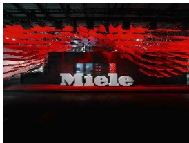
Foto 1: Auf der Milan Design Week 2026 erweckt Miele mit seinem Messestand das Konzept „Designed to Move with You“ zum Leben – als offener, dynamischer Lebensraum, der sich den täglichen Routinen anpasst und physische wie digitale Elemente zu einem intuitiven Gesamterlebnis verbindet.