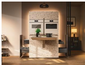
Foto 5: Mit „Miele Compact Living: Kitchen Unit powered by Hettich“ zeigt Miele eine Designstudie für hochfunktionale und flexible Küchenlösungen – selbst auf kleinstem Raum. Durch die Verbindung von Geräten mit flexiblen Möbelsystemen reagiert das Konzept auf die steigenden Anforderungen an effizientes urbanes Wohnen, ohne Abstriche bei Leistung und Design. (Foto: Miele)

Foto 4: Die neue Dampfgeschublade von Miele bildet in Kombination mit einem 45 cm Kompaktbackofen mit Mikrowelle in einer 60-cm-Nische eine platzsparende 3-in-1-Lösung für Backen, Aufwärmen und Dampfgaren. Zwei separate Garbehälter ermöglichen die gleichzeitige Zubereitung unterschiedlicher Speisen. (Foto: Miele)