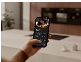
Foto 8: Mit dem CulinaryCoach präsentiert Miele einen KI-gestützten Assistenten, der in Echtzeit personalisierte Kochanleitungen liefert, Nutzerinnen und Nutzer nahtlos mit ihren Geräten vernetzt und Kochen im Alltag intuitiver und flexibler macht. (Foto: Miele)

Foto 7: Die integrierte Glaspaneel-Dunstabzugshaube DAG 2950 bleibt im geschlossenen Zustand nahezu unsichtbar im Oberschrank verborgen. Beim Kochen klappt das Paneel auf, ermöglicht eine direkte Bedienung und schützt zugleich den Schrankkorpus vor aufsteigendem Dampf. (Foto: Miele)