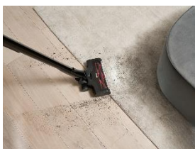
Foto 4: Auf Hartböden überzeugt der Triflex HX3 durch eine um 33 Prozent verlängerte Laufzeit* im Vergleich zum Vorgängermodell – ideal für die Reinigung großer Flächen ohne Ladeunterbrechung. Bis zu 70 Minuten Akku-Power stehen zur Verfügung, wenn die PowerUnit, bestehend aus Motoreinheit, Akku und Staubbox, solo benutzt wird. (Foto: Miele)

Foto 3: Die neue AquaTwister Düse macht den Triflex HX3 zum Nassreiniger. Zwei rotierende Pads an der Unterseite der Düse ermöglichen eine intensive Tiefenreinigung aller Hartböden. (Foto: Miele)