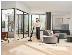
Foto 1: Mit dem Triflex HX3 Aqua bringt Miele ab Mai ein System in den Handel, das Saugen und Wischen in einem Gerät zusammenführt. Für den Wechsel genügt ein Handgriff – die neue AquaTwister Bodendüse macht den Triflex HX3 zum Nassreiniger.