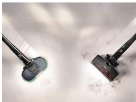
Foto 2: Für den Wechsel vom Saugen zum Wischen genügt ein Handgriff – die neue AquaTwister Bodendüse macht den Triflex HX3 zum Nassreiniger. (Foto: Miele)

Foto 1: Mit dem Triflex HX3 Aqua bringt Miele ab Mai ein System in den Handel, das Saugen und Wischen in einem Gerät zusammenführt. Für den Wechsel genügt ein Handgriff – die neue AquaTwister Bodendüse macht den Triflex HX3 zum Nassreiniger. (Foto: Miele)