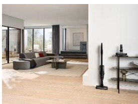
Foto 5: Mit dem Triflex HX3 Aqua bringt Miele ab Mai ein System in den Handel, das Saugen und Wischen in einem Gerät zusammenführt. Für den Wechsel genügt ein Handgriff – die neue AquaTwister Bodendüse macht den Triflex HX3 zum Nassreiniger. (Foto: Miele)

Foto 4: Auf Hartböden überzeugt der Triflex HX3 durch eine um 33 Prozent verlängerte Laufzeit* im Vergleich zum Vorgängermodell – ideal für die Reinigung großer Flächen ohne Ladeunterbrechung. Bis zu 70 Minuten Akku-Power stehen zur Verfügung, wenn die PowerUnit, bestehend aus Motoreinheit, Akku und Staubbox, solo benutzt wird. (Foto: Miele)