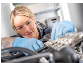
Foto 2: Die Safety AirPro-Technologie steigert die Prozesssicherheit bei der Aufbereitung von Lungenautomaten und ermöglicht Einsatzkräften, sich jederzeit auf ihre Ausrüstung zu verlassen. (Foto: Miele)

Foto 1: Die neuen Einsätze für ExpertLine- und SlimLine-Geräte bieten Platz für bis zu sechs beziehungsweise vier Lungenautomaten und stellen durch die integrierte Druckluftversorgung sicher, dass alle Komponenten während des gesamten Aufbereitungsprozesses zuverlässig unter Druck stehen. (Foto: Miele)