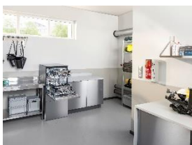
Foto 3: Platzsparend integrierbar in bestehende Werkstattbereiche: Die Safety AirPro-Lösung ermöglicht mit ihren Untertischgeräten eine ergonomische Beladung und sorgt für effiziente, sichere Abläufe bei der Aufbereitung von Atemschutzkomponenten. (Foto: Miele)

Foto 2: Die Safety AirPro-Technologie steigert die Prozesssicherheit bei der Aufbereitung von Lungenautomaten und ermöglicht Einsatzkräften, sich jederzeit auf ihre Ausrüstung zu verlassen. (Foto: Miele)