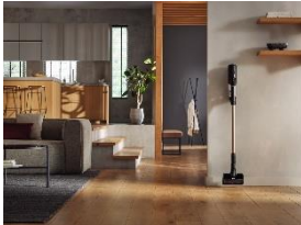
Foto 1: Der neue Miele Duoflex HX1 lässt sich durch sein ansprechendes und modernes Design sichtbar in das Wohnumfeld integrieren. Lästiges Verstauen gehört damit der Vergangenheit an.