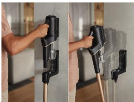
Foto 3: Die SpeedLock-Wandhalterung des Miele Duoflex HX1 ermöglicht den passenden Geräteaufbau mit nur einem Handgriff.

Download Text und Fotos: www.miele-presse.de