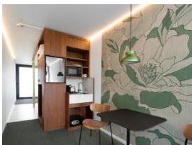
Foto 4: Platz für eine Mahlzeit, Mikrowelle und ein Kühlschrank: Die Zimmer bieten alles, was eine Übernachtung zum rundum gelungenen Erlebnis werden lässt. (Foto: Miele)

Foto 3: Für saubere Textilien in allen Zimmern sorgt nachhaltige Wäschereitechnik von Miele Professional – zum Beispiel mit Eco-Programmen und kurzen Laufzeiten. (Foto: Miele)