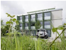
Foto 1: Im Grünen: Das TIN INN-Hotel in Meckenheim liegt an der beliebten „Apfelroute“. Hier checken deshalb am Wochenende auch Gäste ein, die auf Rädern oder zu Fuß unterwegs sind.