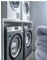
Foto 3: Für saubere Textilien in allen Zimmern sorgt nachhaltige Wäschereitechnik von Miele Professional – zum Beispiel mit Eco-Programmen und kurzen Laufzeiten. (Foto: Miele)

Foto 2: Nico Sauerland, Co-CEO der TIN INN-Hotels, setzt auf erneuerbare Energien und deshalb auch auf Wohnmodule, wie sie im „Containerwerk“ in Wassenberg aus alten Schiffscontainern hergestellt werden. Sie sind die Bausubstanz aller Hotels der Kette. (Foto: Miele)