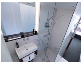
Foto 6: Jedes Zimmer ist mit einem eigenen, geräumigen Bad ausgestattet. Föhn und Duschgel liegen ebenfalls bereit. (Foto: Miele)

Foto 5: Auch die breiten Bettlaken aus den Komfort-Zimmern werden in Maschinen von Miele Professional sauber – so oft die Gäste wünschen. (Foto: Miele)