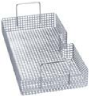
2 x Einsatz AK 12 zur Aufnahme von diversen Utensilien